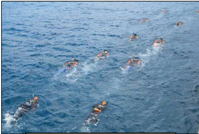
ドルフィン泳法中の両機関潜水土