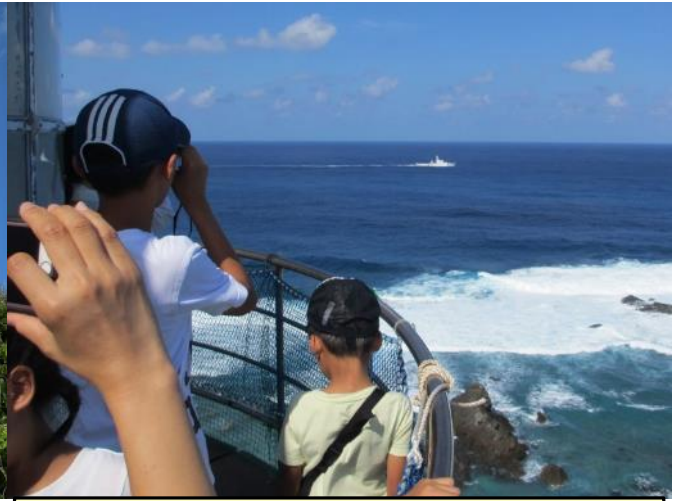
沖を航行する巡視船あまぎを撮影する参観者