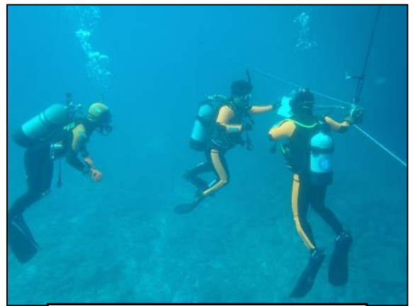
平行搜索訓練中の消防潜水土

令和元年11月6日(水)、巡視船あまぎ潜水土(4名)と大島地区消防組合喜界消防分署潜水土(7名)による合同潜水訓練を実施しました。