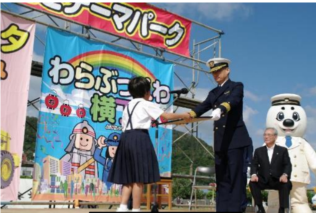
図画コンクール表彰