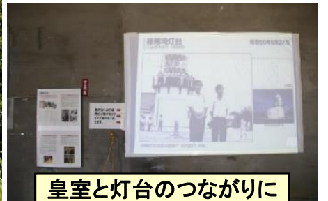
皇室と灯台のつながりに 関する資料等の展示

令和元年10月22日（火）に天皇陛下御即位慶祝行事と151周年灯台記念日関連行事として、笠利埼灯台を一般公開しました。