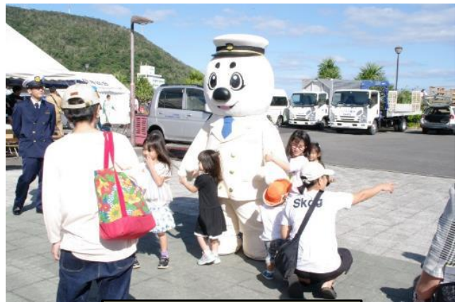
子供に人気のうみまる君

11月17日（日）、奄美で暮らす子供たちに、地域に貢献できる仕事の大切さを伝え、島で働くことを促すために行われるイベント、奄美市主催の「2019おしごとテーマパーク」が開催され、今年も奄美海上保安部は参画しました。