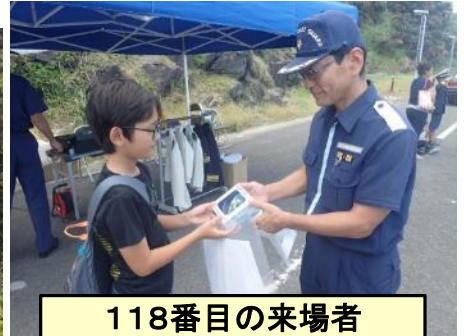
118番目の来場者 地元小学生に記念品贈呈