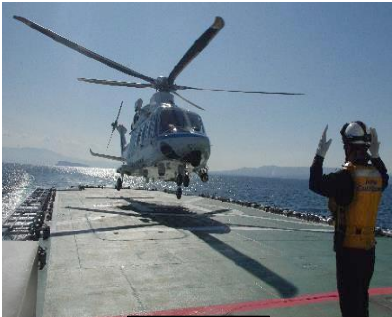
航空機離着船訓練