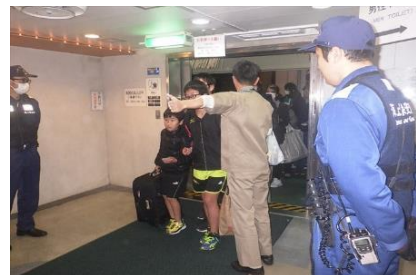
フェリー船内の警戒

海上保安庁では、人や物の輸送が集中する年末年始における事件・事故を防止するため、毎年12月10日から翌年1月10日までの期間、「年末年始特別警戒及び安全指導」を実施しています。