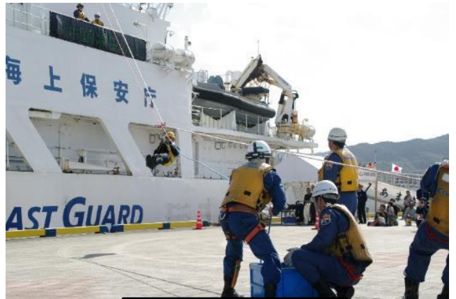
海難救助訓練の展示