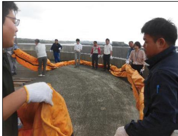
資機材取扱い訓練

令和元年11月25日～12月18日の間、奄美群島排出油等防除協議会支部総会を各島支部において実施しました。