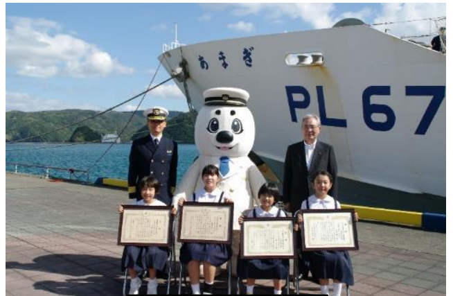
受賞者の記念撮影