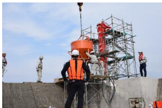
コンクリート打設