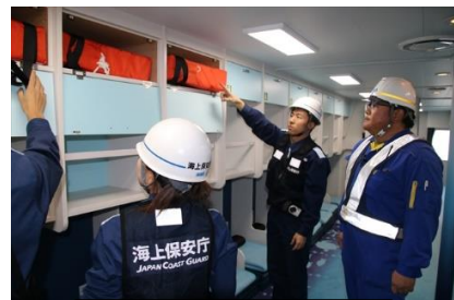
救命設備等の点検