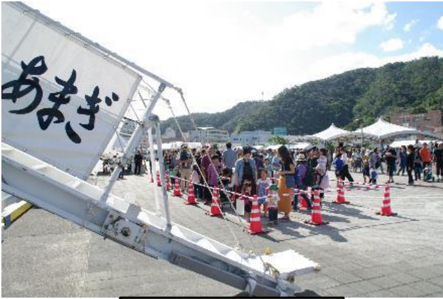
一般公開に長蛇の列