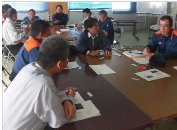
ブレインストーミング